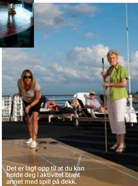
Det er lagt opp til at du kan holde deg i aktivitet blant annet med spill på dekk.

” SELVESTE ROSINEN I CRUISEPØLSA ER AT DET ER KORT VEI TIL LUGAREN. ALLTID. VI TRENGER IKKE YTTERTØY, VI KAN TA PÅ OSS HØYE HÆLER, VI KAN DANSE OG DRIKKE HELE NATTEN.