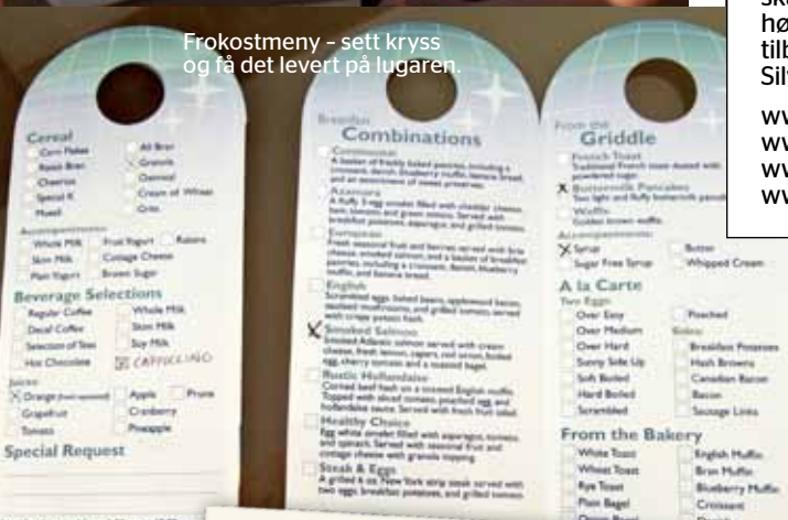
Frokostmeny - sett kryss og få det levert på lugaren