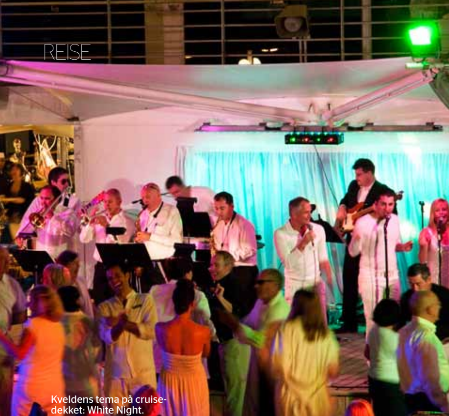
Kveldens tema på cruise-dekket: White Night.