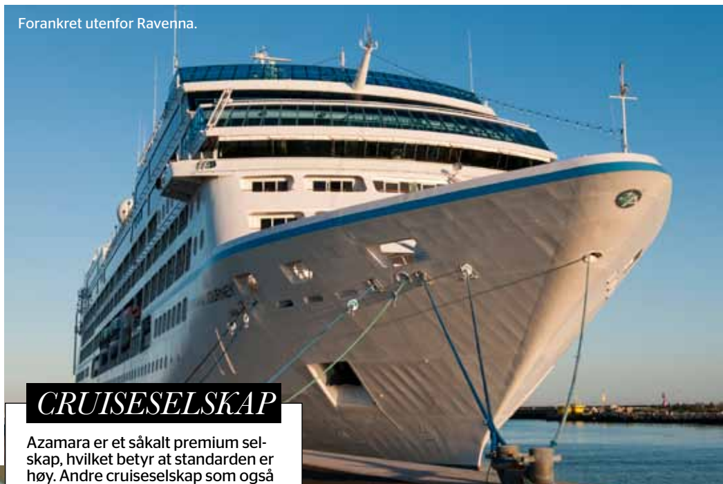
Forankret utenfor Ravenna.