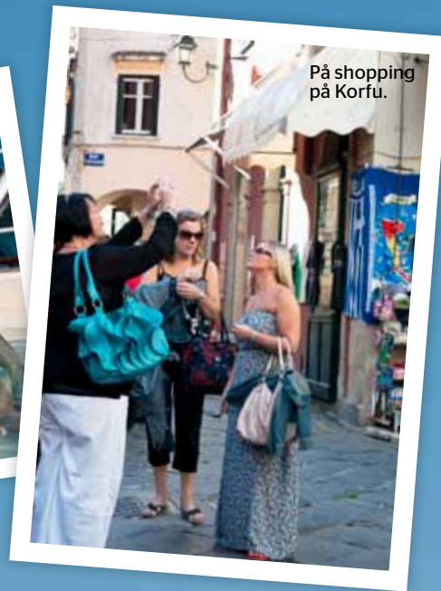
På shopping på Korfu.