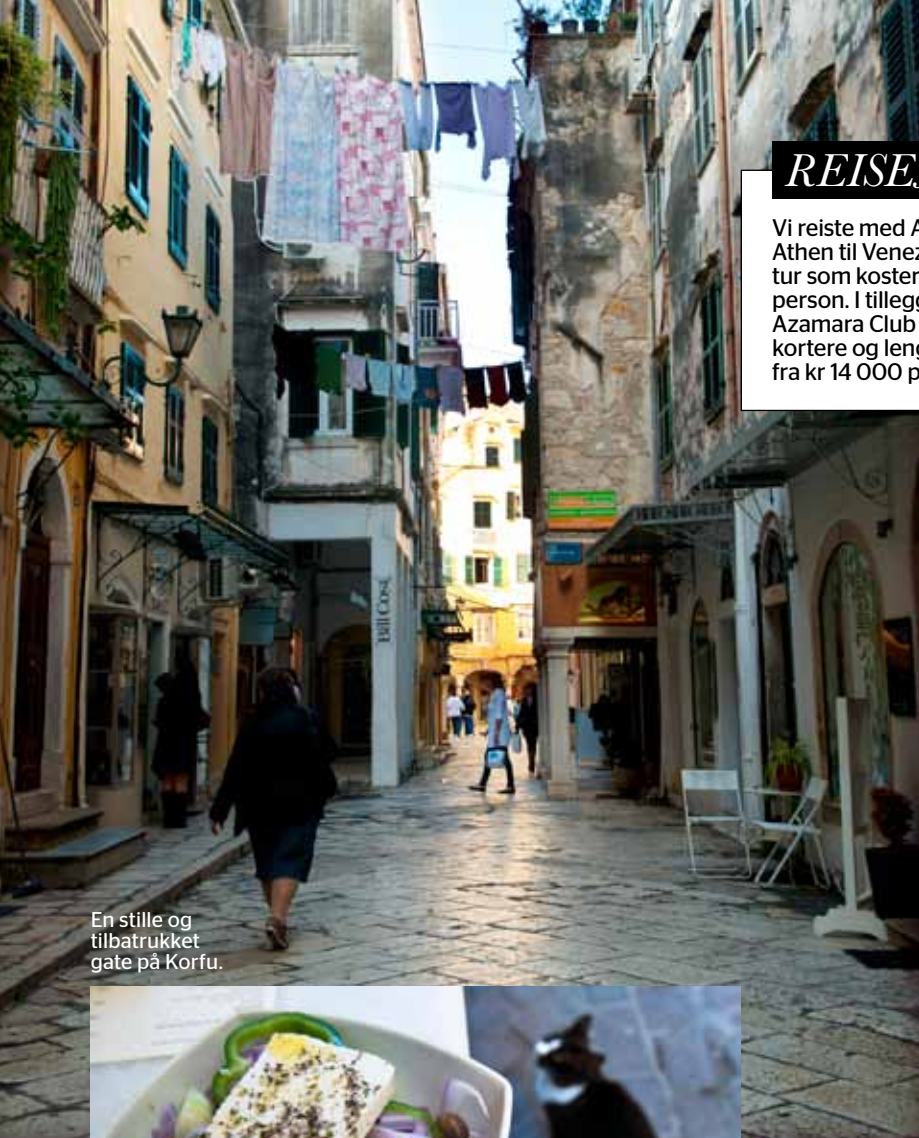
En stille og tilbakrukket gate på Korfu.