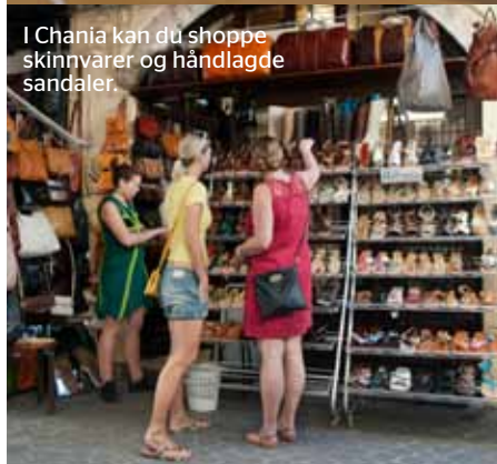
I Chania kan du shoppe skinnvarer og håndlagde sandaler.