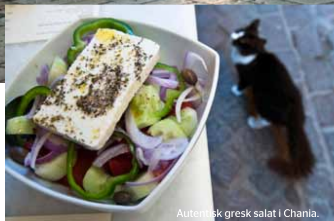
Autentisk gresk salat i Chania.

”CRUISE ER EN FERIEFORM SOM PASSER FOR DE ALLER FLESTE, MED UNNTAK AV DE SOM ER AVHENGIG AV SKIKKELIG ADRENALINKICK FOR Å FØLE AT DE ER PÅ FERIE. HER ER DET HVILEPULS SOM GJELDER.