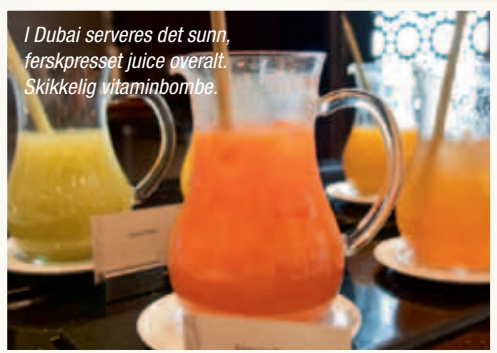
I Dubai serveres det sunn, ferskpresset juice overalt. Skikkelig vitaminbombe.