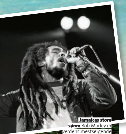
Jamaicas store sønn: Bob Marley er verdens mestselgende reggaeartist noensinne.

Paradis: Seven Mile Beach i Negril er Jamaicas aller vakreste.