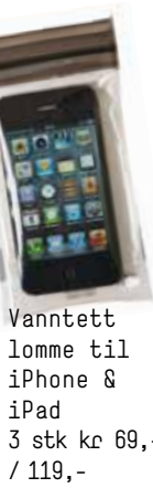
Vanntett lomme til iPhone & iPad 3 stk kr 69,- / 119,-