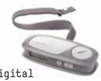
Digital bagasjevekt kr 299,-