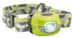
Black Diamond hodelykt kr 549,-