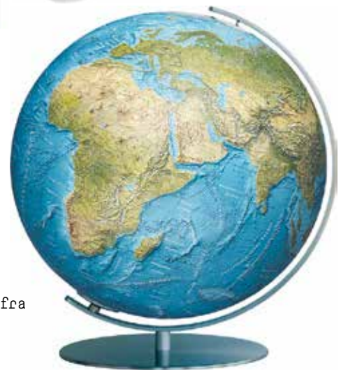
Duorama globus 34 cm 1999,-