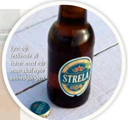
Lyst og leskende øl hører med når man skal nyte solnedgangen.