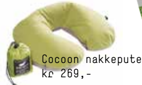
Cocoon nakkepute kr 269,-