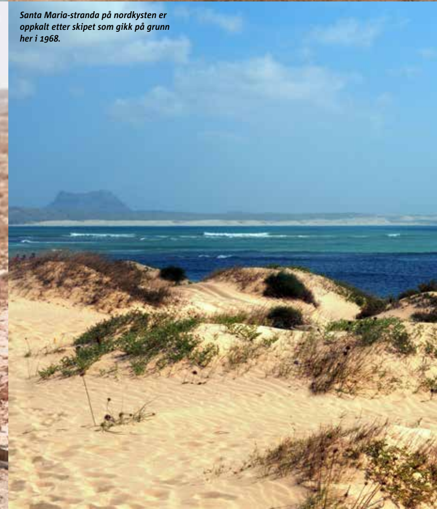
Santa Maria-stranda på nordkysten er oppkalt etter skipet som gikk på grunn her i 1968.