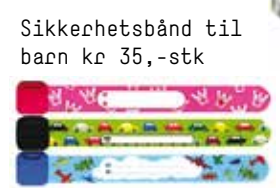
Sikkerhetsbånd til barn kr 35,-stk