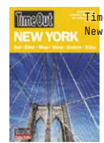
TimeOut: New York kr 189,-