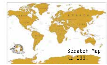
Scratch Map kr 199,-