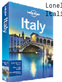
Lonely Planet Italia kr 269,-