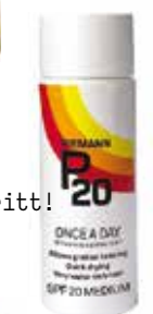
Vår solkremfavoritt! 100ml kr 199,-