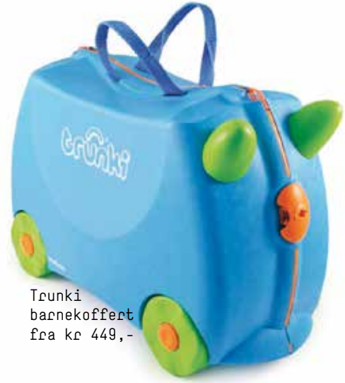
Trunki barnekoffert fra kr 449,-