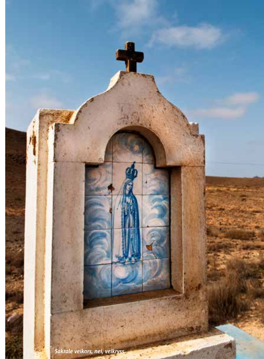
Sakrale veikors, nei, veikryss

MIN PRIVATE VINTERSOL. Men her sitter jeg altså, i en myk himmelseng på første rad på stranda. Finkornet pudersand siler mellom tærne, og et multifarget windsurfersel farer forbi. Hadde jeg befunnet meg i et annet, mer turistifisert paradis, ville denne himmelsenga vært totalt uoppløselig, for ikke å snakke om svinedyr. Men her, i Sal Rei (hovedstaden på Boa Vista), er det fritt fram, gratis for førstemann til mølla. Og i og med at det ikke er så mange andre her, så blir det jeg som kan strekke ut kroppen på hvite puter mens solnedgangen står for tur. De andre gjestene viser seg å være reiseguiden fra Tui, charterarrangøren som bringer ukentlige doser med sydenturister til øya. Når de har fri, kommer de hit, til Estoril-stranda, for å nyte det Boa Vista kan aller best, nemlig treenigheten solskinn, strandliv og chillout. – Jeg har forelsket meg >>>