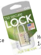
Hengelås TSA 149,-