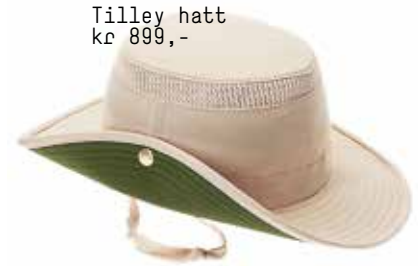
Tilley hatt kr 899,-