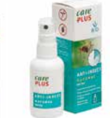
Myggmiddel med naturlige ingredienser 50ml kr 129,-