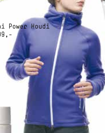
Houdini Power Houdi kr 1699,-