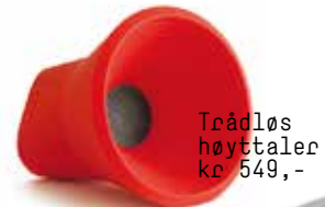
Trådløs høyttaler kr 549,-