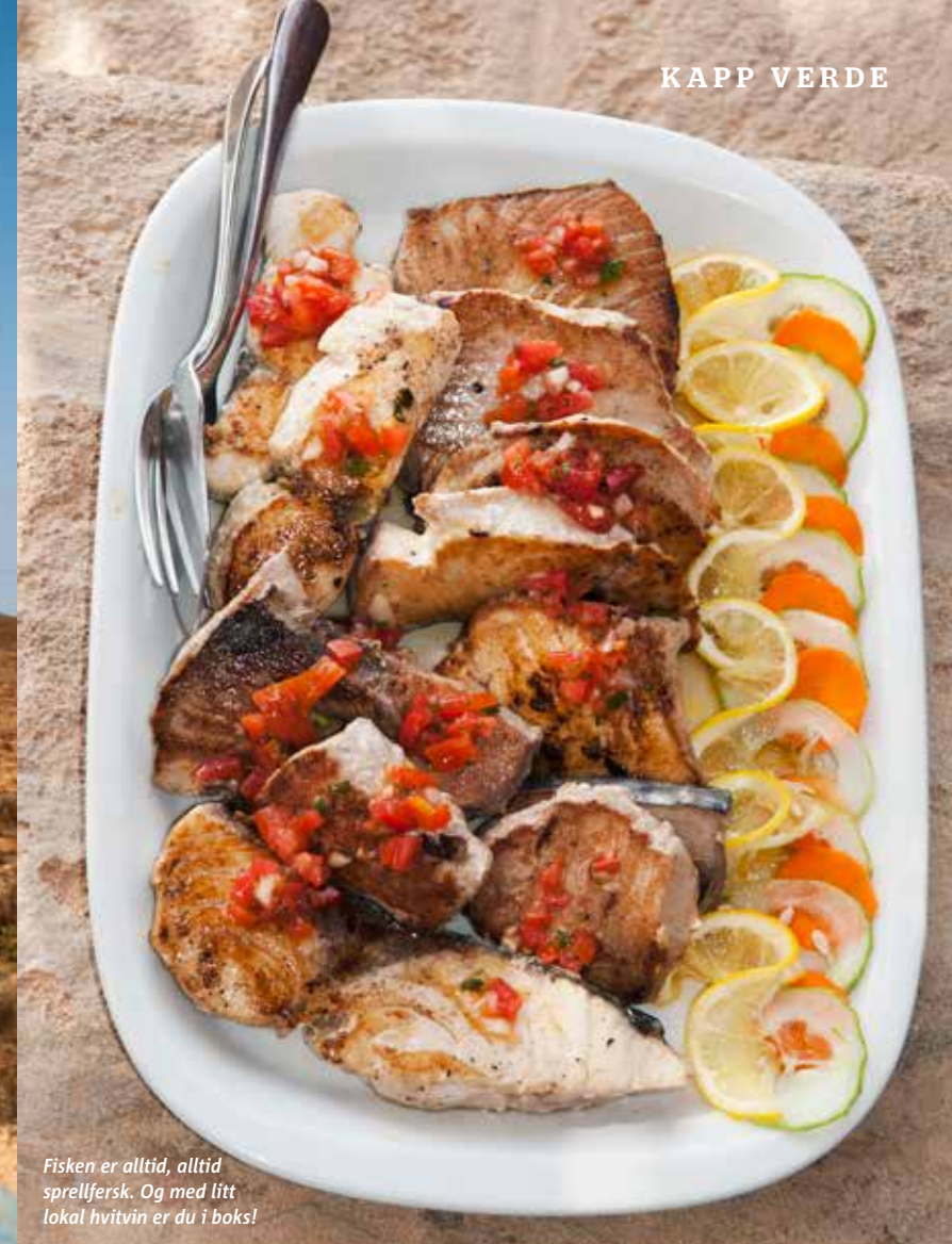
Fisken er alltid, alltid sprellfersk. Og med litt lokal hvitvin er du i boks!