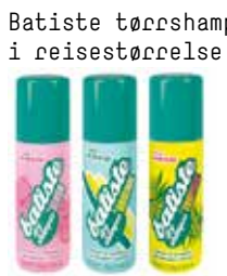
Batiste tørrshampoo i reiseestørelse kr 49,-