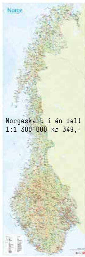
Norgeskart i én del! 1:1 300 000 kr 349,-